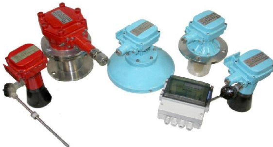
Фото 1. Варианты исполнения АП и ППИ-5Н.

«ЭХО-5Н-В-1,0-61В -2,5-4,0-2-4-УХЛ2 ТУ 4214-098-00225555-2010».